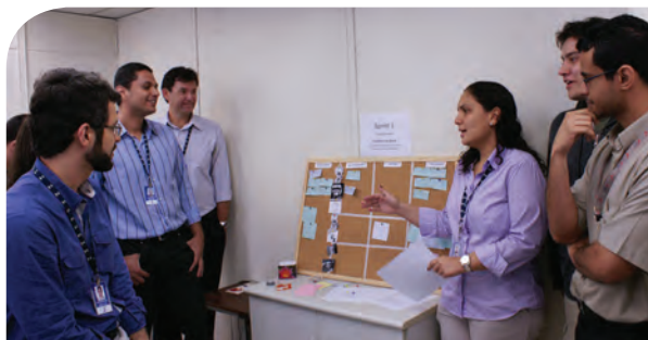
Ctinf adotou a metodologia Scrum para as reuniões: processo dinâmico e participativo.

Para que a Ctinf possa atender com a rapidez