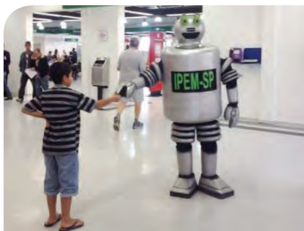
Instituto esteve em Marília e Garça com robô e unidade móvel

A cartilha da dupla Pesado e Medido está disponível para download no site do Ipem-SP.